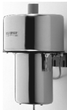
Анализатор аэрозоля модели VisGuard